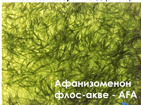
Афанизоменон флос-акве - АФА

Зелена Енергия съдържа три суперхрани и то в идеалното съотношение, за да работят в синергия една с друга, но и с нашия организъм. Когато чуем фразата „зелена енергия“, обикновено я свързваме с възобновяеми енергийни източници. Продуктът Зелена Енергия на AquaSource представлява нещо подобно за човешкото тяло. За разлика